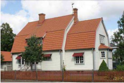
Schylla 8, Strömgatan 29

Utmed Strömgatan ligger flera stora villor från tidigt 1900-tal. Flera av dem är påkostade och välbevarade. När de uppfördes tillhörde de högreståndsbegyggelsen i staden. Byggnaderna är omnämnda i Kulturmiljöprogrammet för centrum.