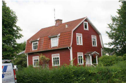
Drako 7, Norra Järnvägsgratan 13

Stor bostadsbyggnad med två våningar och källare som uppfördes omkring 1910 och flyttades till Älgstigen på 70-talet. Byggnaden är påkostad med bland annat torn och burspråk. Fasaden täcks av stäende och liggande träpanel och taket av grönfärgad falsad plåt. Fönstren är spröjsade och i olika storlekar, centralt på fasaden mot gata finns ett stort lunettfönster placerat.