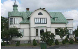
Älgen 16, Älgstigen 3

Stor tvåplansvilla med källare på Agårdsvägen som byggdes på 20-talet. Villans fasad täcks av liggande träpanel i ljusblå kulör med vita snickerier. Mansardtaket är belagt med röda tegelpannor och fönstren är symmetriskt placerade på fasaden. De har en luft och de flesta av dem är spröjsade.