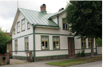
Herkules 3, Strömgatan 13

Utmed Strömgatan ligger flera stora villor från tidigt 1900-tal. Flera av dem är påkostade och välbevarade. När de uppfördes tillhörde de högreståndsbegyggelsen i staden. Byggnaderna är omnämnda i Kulturmiljöprogrammet för centrum.