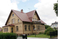
Herkules 15, Strömgatan 19