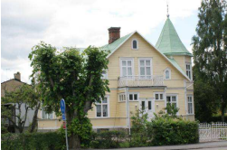
Kvadraten 10, Södra Järnvägsgratan 3

Tvåplansvilla på Norra Järnvägsgratan som uppfördes på 20-talet. Fasadmaterialet är röd liggande träpanel med vita snickerier. Mansardtaket är belagt med rött tegel och fönstren är stora, spröjsade och symmetriskt placerade på fasaden.