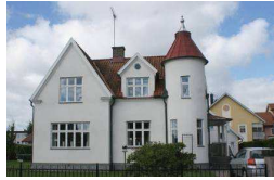
Solon 6, Parkgatan 13

På Råböckstigen finns kedjehus som har liknande karaktär i ordnade former mot gata. De har två plan och är byggda på 50-talet. Fasadmaterialet är tegel, vilket är vitmålat på fasaden mot gata. Sadeltaket täcks av röda tegelpannor och garaget har liknande utformning som huvudbyggnaden. Ritningarna till kedjehusen är utförda av Lennart Nelsson.