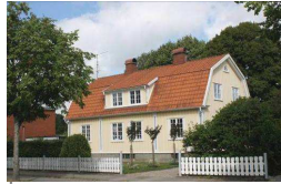
Agårdsvägen 23, Mården 10

Flerfamiljshus med två och ett halvt plan på Borggatan, som byggdes på 30-talet. Fasaden är beklädd med gula cementbaserade skivor med gröna detaljer kring fönster och balkonger. Fönstren är spröjsade och placerade på ett jämt avstånd ifrån varandra. Taktypen är sadeltak och det täcks av tegelpannor. Entréet bärs upp av pilastrar och gårdsbyggnaden har liknande utformning som huvudbyggnaden. Fastigheten är omnämnd i Kulturmiljöprogrammet från 2002.