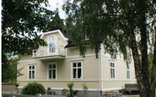
Herkules 4, Strömgatan 15

Bebyggelsen i området har vuxit fram från de sydvästra mest centrala delarna, mer och mer öster och norrut. Det finns stora relativt orörda kvarter där små förändringar kan påverka helheten.