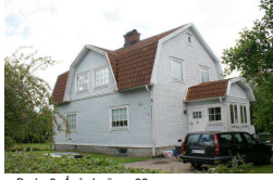
Drako 2, Agårdsvägen 22