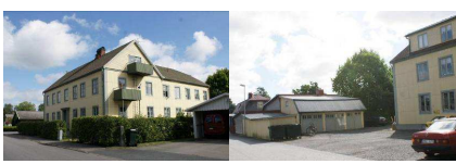
Schylla 23, Borggatan 2

Liten en- och en halvplansvilla på Borggatan, vilken uppfördes på 1910-talet. Fasaden täcks av liggande panel i grå kulör, med vita snickerier kring fönster. Taktypen är mansardtak och är belagt med rödfärgad falsad plåt. Fönstren är spröjsade och i varierande storlekar. Fastigheten är omnämnd i Kulturmiljöprogrammet från 2002.