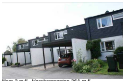
Illern 3 m.fl., Harabergsgatan 36A m.fl.