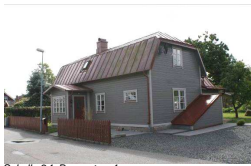
Schylla 24, Borggatan 4

Bostadsbyggnad i två plan på Södra Järnvägsgratan som byggdes på 1910-talet. Husets fasad täcks av gul liggande träpanel med vita snickerier. De flesta av fönstren har korsad mittpost och taket är belagt med grönfärgad falsad plåt. Huset är påkostat med torn och över entrén finns balkong. I tomtrånsen finns en grind med liknande utformning som balkongräckena.