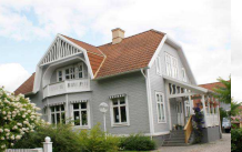
Herkules 5, Strömgatan 17