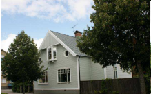
Herkules 1, Strömgatan 11