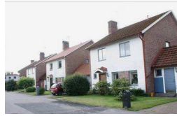
Råböcken 4, 5 m.fl., Råböckstigen 2, 4 m.fl.

Stor och välbevarad tvåplansvilla med källare utmed Agårdsvägen som uppfördes på 30-talet. Villans fasadmateriale är stäende gul träpanel med vita snickerier. Fönstren är stora, spröjsade och placerade på ett jämt avstånd ifrån varandra. Mansardtaket är belagt med rött tegel. Mot gatan finns en takkupa och på gavlarna lunettfönster.