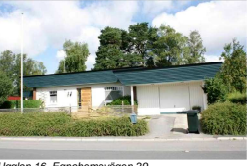
Ugglan 16, Egnahemsvägen 29

Tvåplansvilla med källare på Strömgatan som 1999 flyttades från Aspebacken 25 till nuvarande plats. Den uppfördes på 30-talet och byggdes om efter den flyttats. Villans fasadmateriale är liggande träpanel i ljusgrön kulör. Mansardtaket täcks av röda tegelpannor och fönstren är spröjsade samt i varierande storlekar. Huset består av två förskjutna byggnadskroppar och på fasaden finns även takkupa och burspråk.