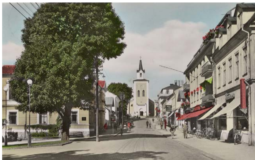
Storgatan Ljungby 1950

Vår stad lever och förändras med de människor som bor här. Ibland måste hus få förändras och ibland måste något rivas. Ibland måste vi tillåta helt nya byggnader med vår tids arkitektur. Husen omkring oss påverkar oss i det dagliga livet. De väcker känslor hos oss. Vackra och välvårdade hus får oss att känna stolthet och välbehag medan andra kan göra oss nedstämda. Det är därför viktigt att vi är varsamma med våra byggnader - anblicken av dem är vår gemensamma egendom i det offentliga rummet.