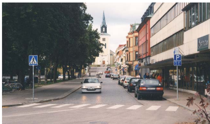
Storgatan Ljungby 2000