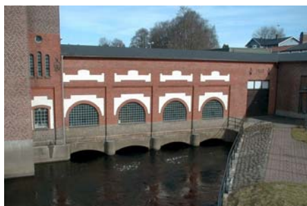
Ljungby blir stad 1936

Järnvägen och järnvägsbyggandet har också på flera sätt påverkat köpingen trots att trakten gick miste om dragningen av södra stambanan genom Lagadalen. Från tiden kring 1878 då Vislanda – Bolmens järnväg invigdes och sedermera när Skåne – Smålands järnväg öppnades 1899, hade orten mycket goda person- och godsförbindelser. Men Ljungbys era som järnvägsknut blev kort. Vid mitten på 1960-talet lades först smalspåret Vislanda – Bolmen och senare Skåne – Smålands järnväg ner. Den andra betydelsen som järnvägen haft för Ljungby är att den till viss del anlades diagonalt över den rådande kvartersindelningen i staden, vilket medfört många plantekniska problem och andra egendomligheter i staden.