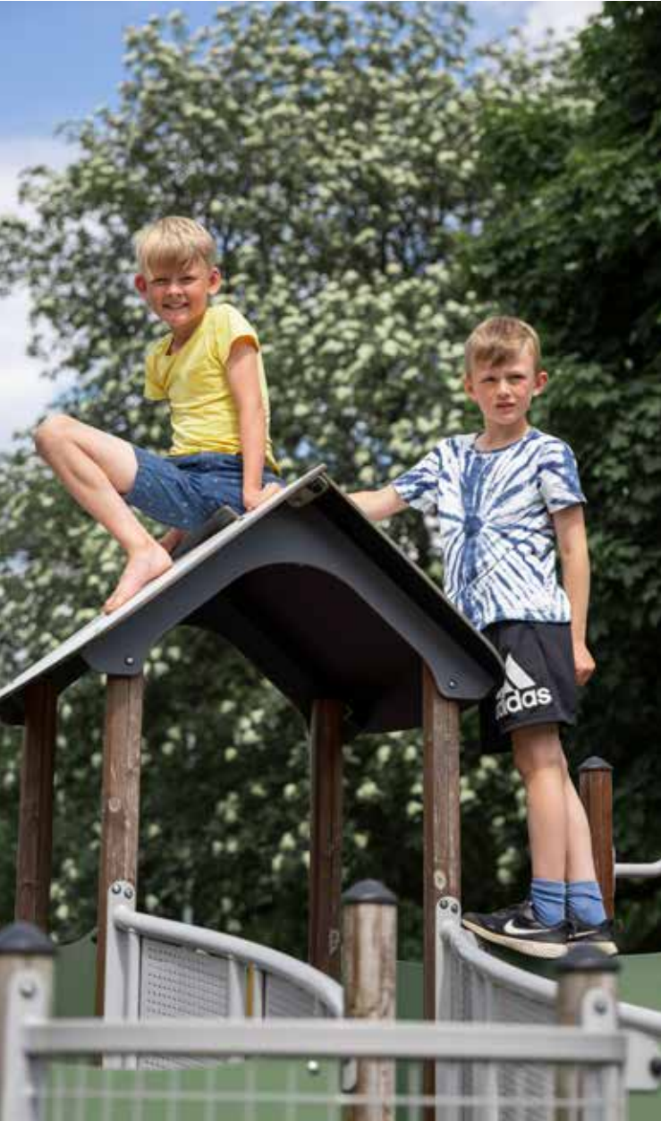
Zeit für Entspannung und Spiel.