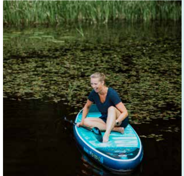
Standup-Paddling. Testen Sie diese beliebte Art, das Wasser zu erleben.

Ljungby ist eine wasserreiche Gemeinde rund um den Bolmensee. Hier finden Sie für alle 365 Tage im Jahr eine Insel. Der Bolmensee bietet Möglichkeiten für Kajakfahren, Angeln und Schwimmen sowie für Radfahren und Wandern rund um den See auf dem 130 km langen Radwanderweg Bolmen Runt.