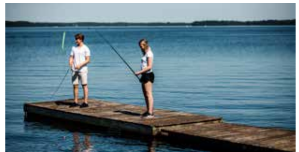
Der See lockt Groß und Klein.

Der Zander ist ein köstlicher Speisefisch, der oft im tiefen Wasser schwimmt. Am aktivsten ist er bei Sonnenauf- und -untergang. Einer der beliebtesten Seen zum Zanderangeln in Südschweden ist der Vidöstern-See, in dem schon Zander von über 10 kg gefangen wurden. Aber mit ein wenig Geschick kann man den Zander zum Beispiel auch im Bolmensee oder im Flärensee fangen. In den Seen Vällingasjön und Hjärtanässjön können eingesetzte Edelfischarten wie Regenbogenforelle oder Forelle geangelt werden.