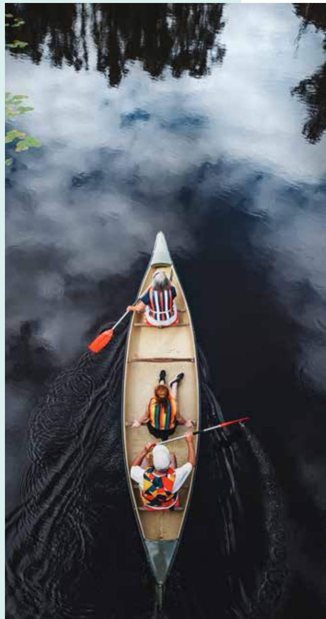
Mieten Sie ein Kanu oder Kajak und fahren Sie hinaus.