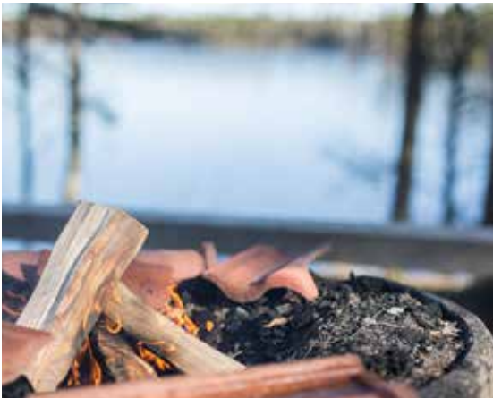
Grillen über offenem Feuer.