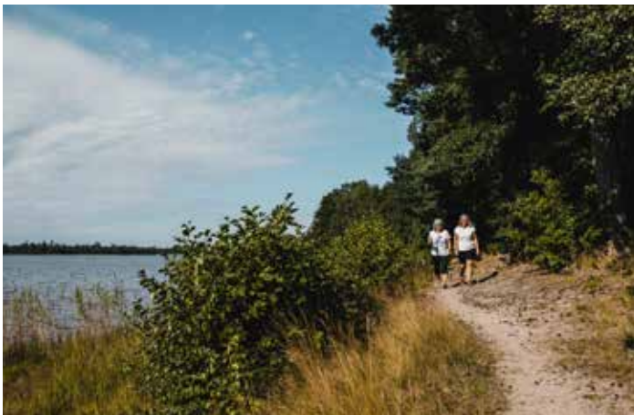
Spaziergang am Ufer.

Sind Sie es leid, in der Hängematte zu liegen und sehnen Sie sich nach Abenteuern? Möchten Sie vielleicht unter den Sternen schlafen oder sich auf einen der vielen Seen in der Gemeinde begeben? Carina ist die Abenteurerin, die gerne eine Nacht im Freien schläft, oder im Kajak paddelt, wenn das Wetter es zulässt. Hier teilt sie ihre Erfahrungen mit allen, die sich lieber auf Abenteuer tour begeben, als im Schatten zu liegen und ein Buch zu lesen. Und denken Sie daran, auch wenn Sie nicht so abenteuerlustig sind, können Sie die Aktivitäten ausprobieren, die zu Ihnen passen.