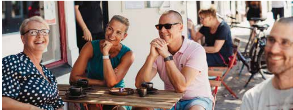
Eine schöne Sommerstadt.