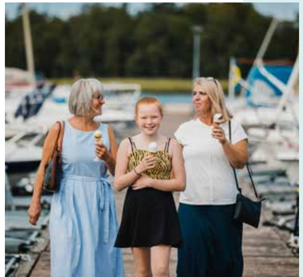
Genießen Sie die Nähe zum Wasser.