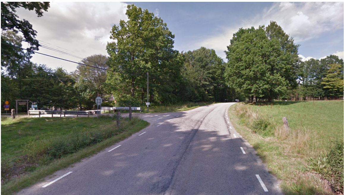
Väg 555 norrut. Aspvägen till vänster.