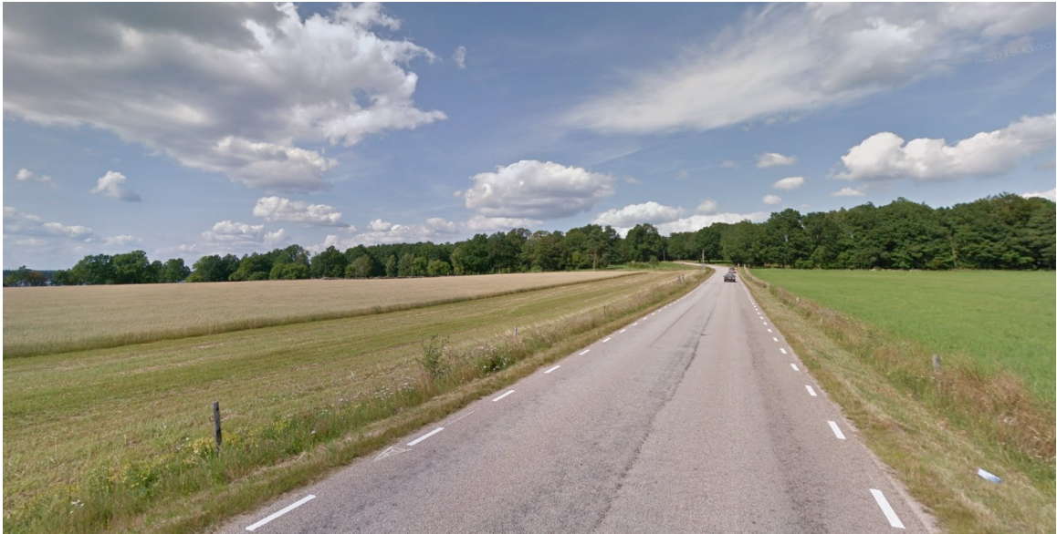
Väg 555 norrut från Bolmstad. Marken till vänster om vägen är planlagd för jordbruksändamål.

Gällande detaljplan sträcker sig sex meter öster om väg 555. Dessa sex meter är markerade som naturpark. Detsamma gäller för marken på västra sidan om vägen upp till Aspvägen, men enbart tre meter brett. Marken längre ifrån vägen mot sjön Bolmen är avsedd för jordbruksändamål, se foto nedan.