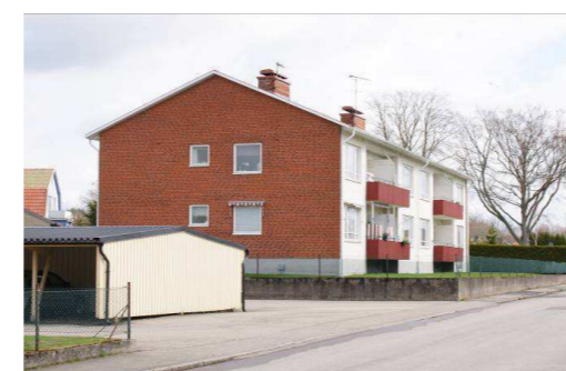
Kopparslagaren 10, Rönnäsvägen 6 & 4

Välbevarad villa som byggdes under mitten av 30-talet. Det branta sadeltaket täcks av rött tegel och fönstren har två lufter. Fasadmaterialet är stående gul träpanel. Huset har 1 ½ plan och takkupa.