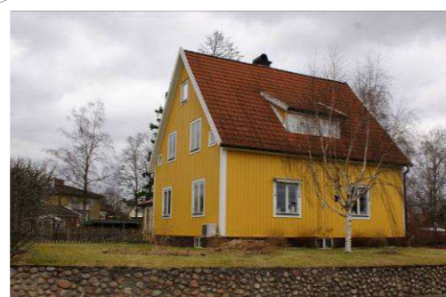
Sliparen 7, Torsgatan 36

Östra delen av Rönnäs innehåller blandad bebyggelse från olika tidsepoker. Även här förekommer några äldre och välbevarade bostadshus utmed Bolmstadsvägen.