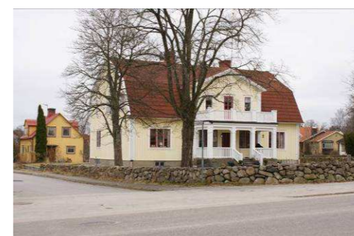
Förvaltaren 16, Bolmstadsvägen 19

Katolska kyrkan byggdes under slutet av 60-talet i en relativt utpräglad modernistisk stil. Kyrkan är byggd i souterräng och består av två huskroppar med pulpettak som är sammanbyggda i mitten. Fasaden täcks av vitt sandstenstegel och detaljerna kring fönster, dörrar, tak och skorsten är målade i samma blåa kulör. Ritningar är gjorda av Lennart Nelssons arkitektkontor.