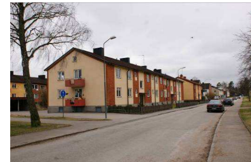
Lärlingen 3, Rönnäsvägen 21 m.fl

Relativt välbevarat flerbostadshusområde från 1950-talet i form av lamellhus med 2 våningar och källare. Fasadmaterialet är en kombination av tegel och puts och taket är pannbelagt. Fönstren har två lufter och lägenheterna har öppna balkonger med röd korrugerad plåt mot gaveln och baksidan.