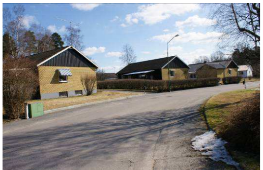
Mandolinen 3, 4, och 5, Sångarvägen 6,4 samt 2

Homogen bebyggelse med radhuskaraktär i två våningar och källare. Fasaden täcks av rött tegel och svart liggande träpanel, fönstren är i två lufter och taket är ett flackt sadeltak. Totalt finns det 14 likadana kedjehus på Barrstigen och Hovdingegatan. Husen är byggda i början av 60-talet. Husen är ritade av Gösta Fredblad & Hugo Höstrup.