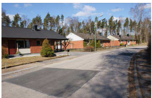
Trumpeten 3, 2, och 1, Torsgatan 87, 89 samt 91

Område med mycket enhetlig grupphusbebyggelse i ordnade former mot gata. Fasaderna täcks av gult tegel och svart träpanel på röstet samt ena långsidan. Husen har enlufsfönster samt sadeltak med betongpannor. Villorna byggdes under slutet av 60-talet.