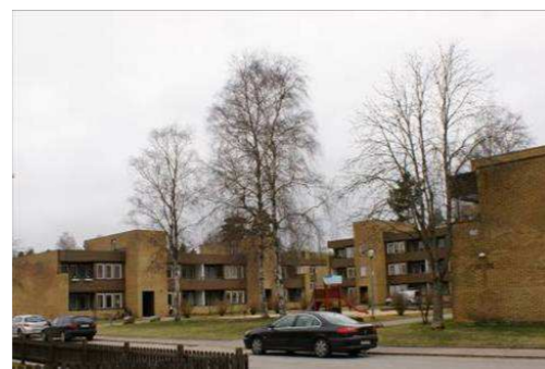
Mossen 1, Rönnäsvägen 30 m.fl

Flerbostadshusområde från 1970-talet som är tidstypiskt planerat med kringbyggd parkering, lekplats och förskoleverksamhet. De sammanbyggda huskropparna har i längst in på gården tre våningar men skalas ner till två våningar mot gata. Byggnaderna har gult fasadtegel och en mörk träpanel och taken är platta. Trapphusen kragar ut från fasaderna och reser sig ovan takfoten. Området är ritat och konstruerat av B.Gunnarsson & J. Spangenberg, Älmhult.