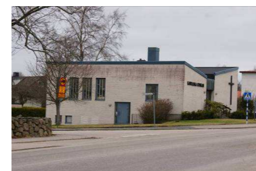
Mästaren 7, Bolmstadsvägen 21

Tidstypiskt Lamellhus som uppförts på 60-talet. Byggnadens fasadmateriäl är vit puts på långsidan och rött tegel på gaveln. Alla lägenheter har öppna balkonger med sinuskorrugerad plåt. Konstruktionsritningar har gjorts av O.W. Johanssons konstruktionsbyrå, Halmstad.