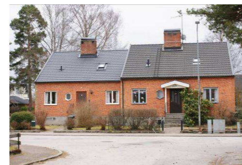
Gesällen 11 och 2, Rönnäsvägen 17A & B

Flerbostadshusområde från 1970-talet som är tidstypiskt planerat med kringbyggd parkering, lekplats och förskoleverksamhet. De sammanbyggda huskropparna har i längst in på gården tre våningar men skalas ner till två våningar mot gata. Byggnaderna har gult fasadtegel och en mörk träpanel och taken är platta. Trapphusen kragar ut från fasaderna och reser sig ovan takfoten. Området är ritat och konstruerat av B.Gunnarsson & J. Spangenberg, Älmhult.