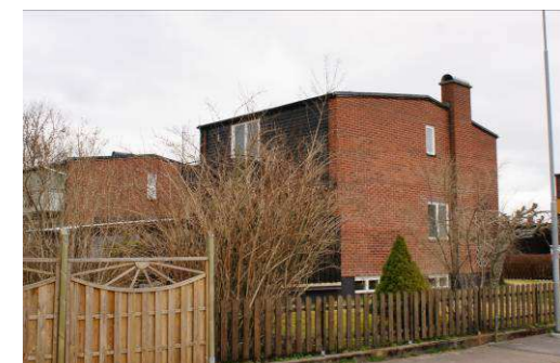
Skomakaren 30, Barrstigen 38

Relativt välbevarat flerbostadshusområde från 1950-talet i form av lamellhus med 2 våningar och källare. Fasadmaterialet är en kombination av tegel och puts och taket är pannbelagt. Fönstren har två lufter och lägenheterna har öppna balkonger med röd korrugerad plåt mot gaveln och baksidan.