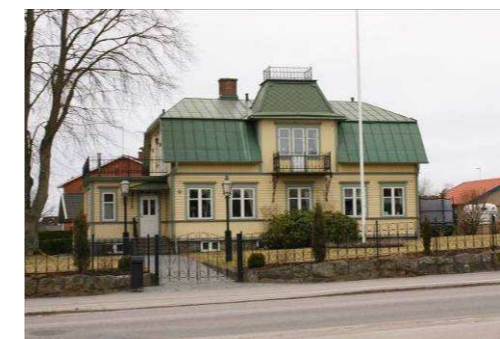
Kopparslagen 1, Bolmstadsvägen 25

Parhus som är ett sedvanligt exempel på 1950-talsbebyggelse. Huskropparna är förskjutna i sidled, fasaden är täckt av rött fasadtegel. Byggnaden har för tiden typiska fönster med två lufter. Den sexkantiga fönsterbågen vid toaletten är också en mycket vanlig detalj. Här finns tre huskroppar med sex bostäder och alla tämligen välbevarade. Ritningarna till huset är utförda av Henrik Schenger.