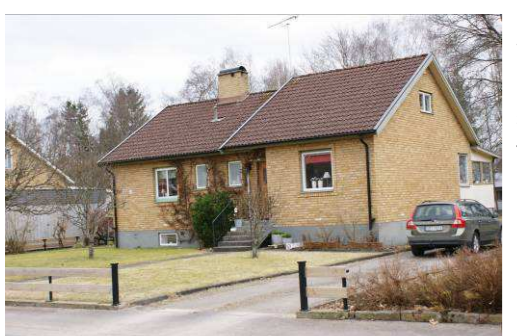
Bryggaren 3, Heimdalsgatan 45

Område med mycket enhetlig grupphusbebyggelse i ordnade former mot gata. Fasadmaterialet är rött tegel och grå träpanel på gavelpetsarna. Sadeltaken täcks av svarta betongpannor. De är byggda på slutet av 60- och början av 70-talet. Ritningar är utförda av Sv. Riksbyggen, proj. Avd.